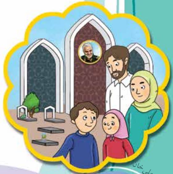
مجموعه‌ی گنج علی خان

بالاخره بابا به قولش عمل کرد. می دانستم وقتی بابا چیزی بگوید، حتماً اتفاق می افتد. وقتی سردار سلیمانی به شهادت رسید و ما در مراسم تشییع ایشان شرکت کردیم، من و مامان و داداشی خیلی دوست داشتیم به شهر کرمان سفر کنیم. بابا عید امسال را برای سفر به این شهر انتخاب کرد. بابا به ما گفته بود بهترین زمان سفر به کرمان، فصل بهار است؛ چون هوای این استان در این فصل دلپذیر است. اولین مقصد ما در این شهر، آرامگاه شهید سلیمانی بود. آنجا مکانی بسیار شلوغ ولی آرامش بخش بود. شهید سلیمانی در کنار یاران شهیدش میزبان ما بود. باز هم معنای «شهادت»، دفاع مقدس، مدافعان حرم، جنگ و جبهه» در ذهن من پررنگ شد. بعد از اینجا، به مجموعه‌ی گنج علی خان رفتیم. مامان می گفت زیباترین بخش این مجموعه، حمام آن است. معماری زیبا در کنار مهندسی هوشمندانه‌ی ایرانی، دیدنی بود.